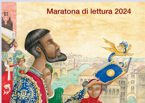
Illustrazione di Michelangelo Rossato tratta dal libro "Marco Polo" edizioni AFKA 2024